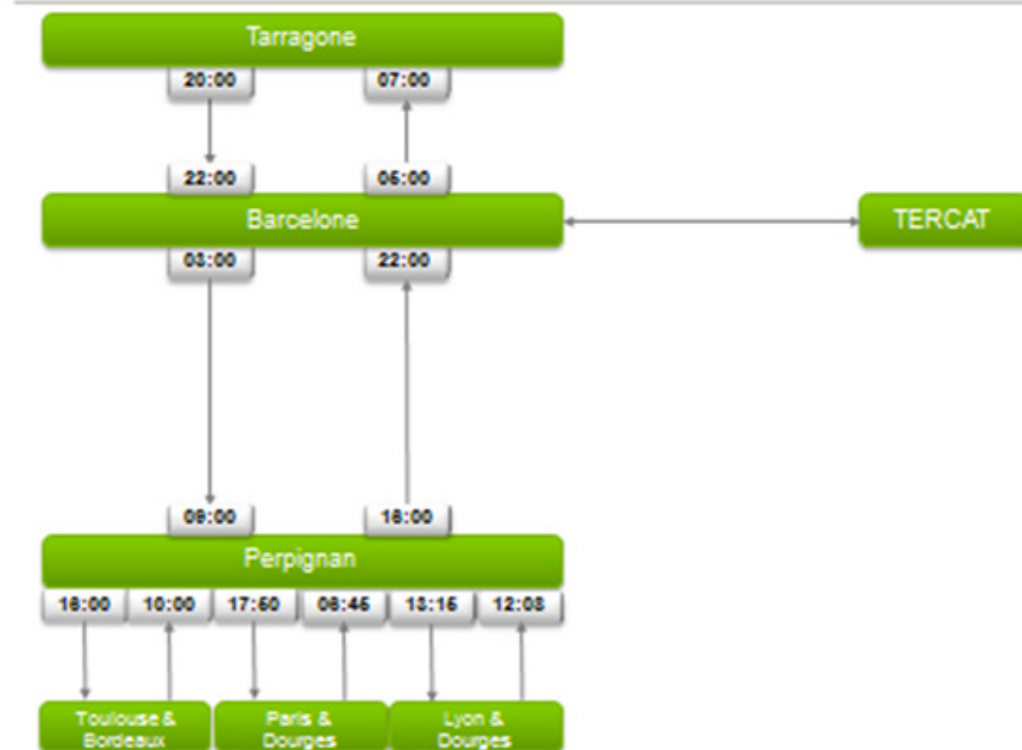
Schéma TRANSPYRENAEI V1 Heures de départ et heures d'arrivée